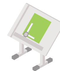
Projektová příprava a komunikační kampaň

Nutno zrenovovat přes 2000 budov De facto nahrazuje rozpočtové financování 100% podpora z programu